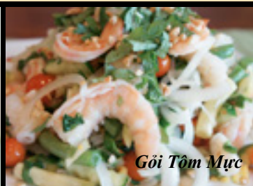
Gỏi Tôm Mực